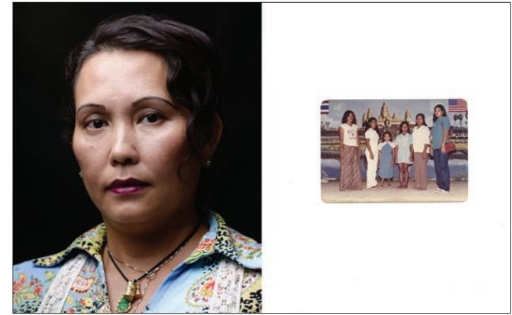
From top: Seoun Som , Devold of Presence 2 , 2009, dye-sublimation on polyester chiffon, 152x152cm. Amy Lee Sanford , Jan 28, 1974 , 2013, archival pigment print, 60x30cm. Pete Pin , Untitled , from series Cambodian Diaspora: Memory , 2014, archival pigment print, 91 x 152cm.